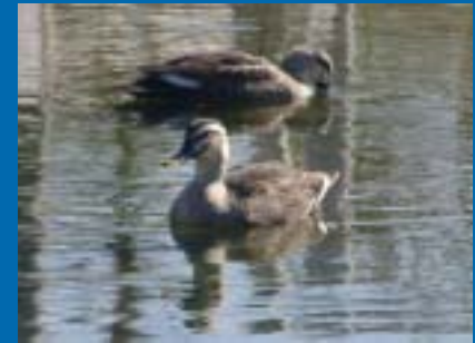
清瀬下宿ビオトープ公園の池に飛来したカルガモ