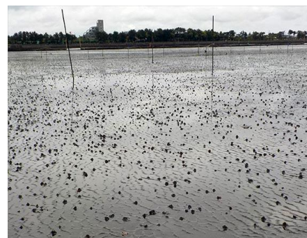
砂とぐろが目立つ

程度あった。また、膜を払って移動中の小さなツメタ貝を発見。夜行性なので、エサが乏しいので日中も活動していたのだろうか。常連のマメコブシガニも沖の方でけっこう多かった。