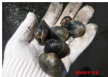
コアマモ原で取れたアサリ、黒ずんだ模様で4cmくらいのが多い。