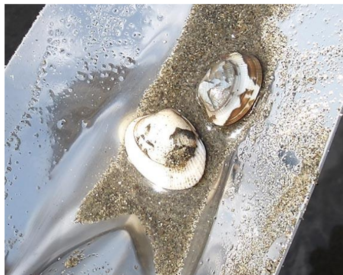
2cmほどのアサリの稚貝 模様が2段になっていて生育途中で大きな環境変化があったように見える

調査は浜への入口左の、貝が撒かれていないところから始めた。ここでは潮干狩り場は歩いて10分以上もかかる沖の区画の中であった。沖の方へ移動しつつ所々掘って調べた。ここも貝の生息は非常に少なく、アサリ稚貝一つが2回に一回見られる程度。稚貝の殻は茶色と白のこの辺特有のもの。貝殻模様が2段になって、生育途中で長い距離流されるなどの大きな環境変化が考えられる。たまにけっこうの大きさのハマグリが取れ、自分も沖までの調査時間90分で6cm、4.5cm、2.5cmの3個、他のメンバーも同程度取れた。一番沖の所で一カ所で作業をしている人がいた。マテ貝の穴に塩をいれて飛び出してくるマテ貝を捕まえるもの。15個くらいもあり、場所によってけっこうな生息密度になっているようである。その後、潮干狩り場まで戻り、お土産の貝掘りをした。