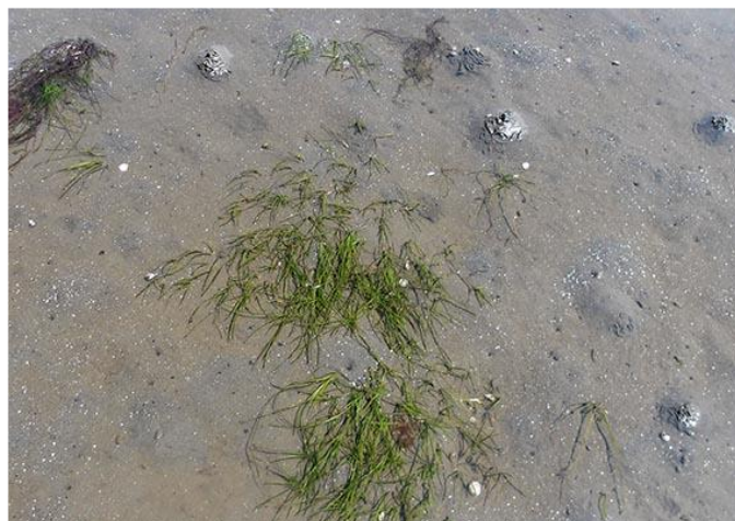
沖の方に行くにつれアマモが増えてくる。ここら辺まで砂とグロが多い。

沖の方にしばらく歩いていくとコアマモが見られるようになり、アサリが出現しだした。3~4百メートルくらいだろうコアマモが大きく広がっていて、大きなアサリやシオフキがある程度存在。コアマモがアサリの生育に良いということを示している。ただし熊手操作2回に1回という程度。アサリの大きさはこの辺では普通3cm程度であるが約4cm程度と大きいのが大半で、稚貝が少ない。これは最近の定着が少ないことを示しているようである。今年3月の東京湾シンポジウムで、千葉県水産技術センターがコアマモを増やすことによってアサリを豊かにする旨の発表をしていた。コアマモの生えていない所に比べ、アサリの数が飛躍的に多いのは明らかであるが、定着の継続性や生息密度など考えると大規模に実施するには効率があまり良くない感がある。